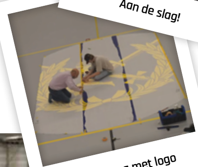
Coatinglaag met logo