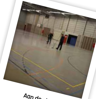
Aan de slag!

is een kleuren coating aangebracht. Ten slotte hebben we de linoleumvloer verzegeld met een laag blanke sportlak om te voldoen aan de sportnormeringen. Vuil en reinigingsmiddelen krijgen hiermee niet de kans om de natuurlijke elementen van het linoleum aan te lasten.